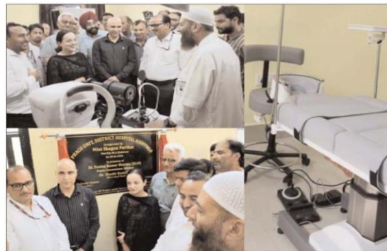
care asset has been made possible under the Environment Management Plan of the Kwar Hydro Electric Power Project, at an estimated cost