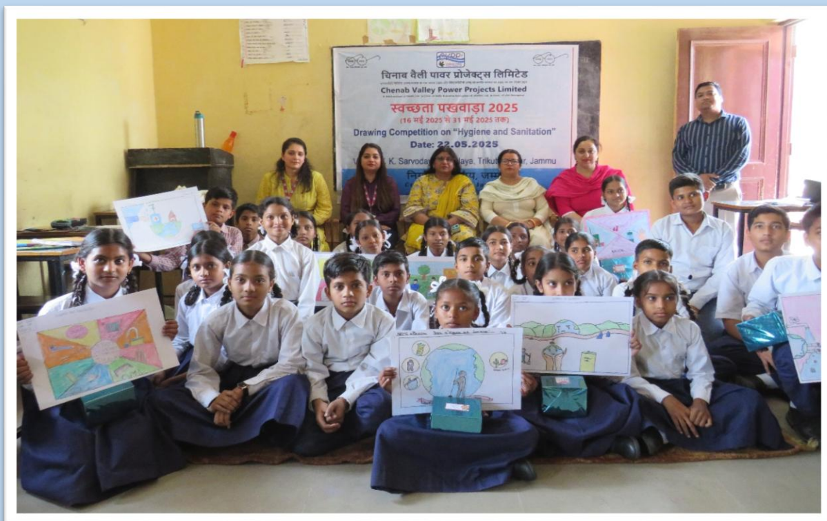
चित्रकला प्रतियोगिता के बाद समूह चित्र Group Photograph after Drawing Competition