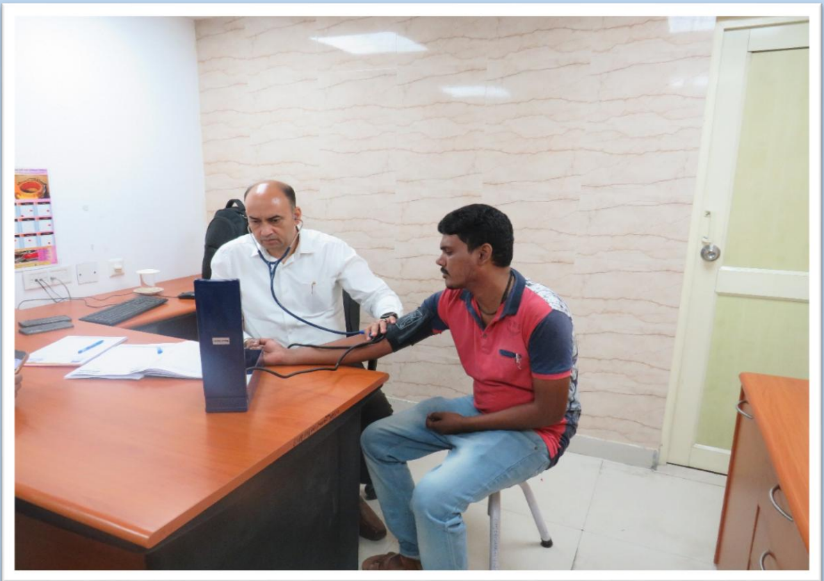
"सफाई कर्मचारी" के लिए सामान्य चिकित्सा जांच General Medical Check-up for "Safai Karamchari"