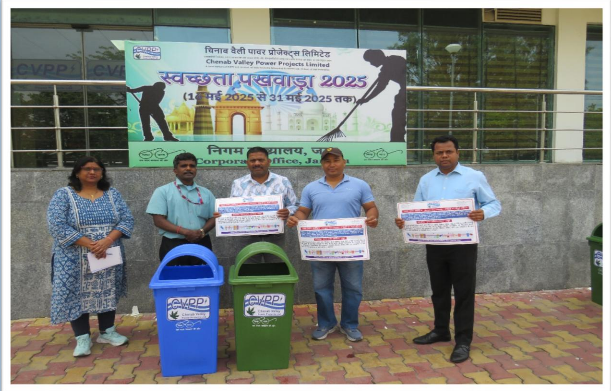
आसपास के विद्यालयों में कूड़ेदान का वितरण Distribution of dustbins to nearby schools