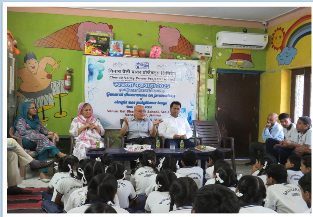
"एकल उपयोग पॉलिथीन बैग की रोकथाम" पर एक सामान्य जागरूकता कार्यक्रम General Awareness Session on "Prevention of Single Use Polythene Bags"