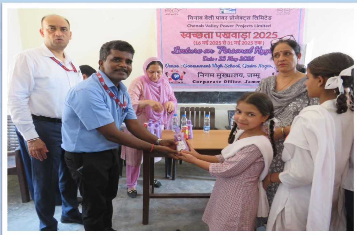
छात्रों को हैंड वॉश और स्वास्थ्य पेय का वितरण Distribution of Hand Wash and health drinks to the students