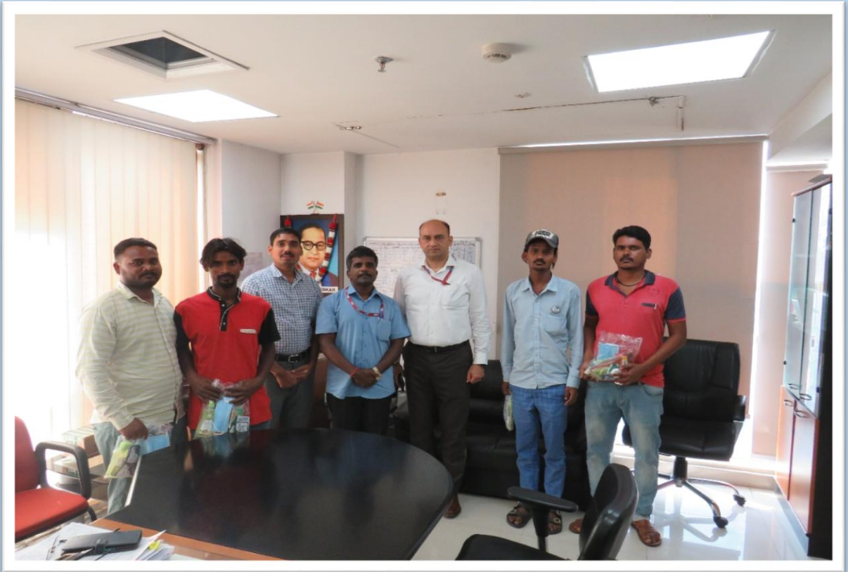
सफाई कर्मचारियों को व्यक्तिगत स्वच्छता किट का वितरण Distribution of personal hygiene kit to safai karamchari