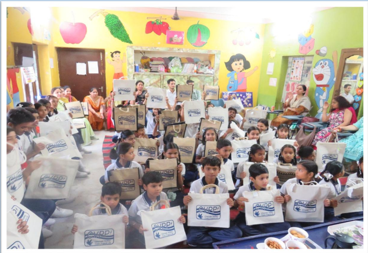
विद्यार्थियों को जूट/कपड़े की थैली का वितरण Distribution of Jute/Cotton Bags to Students