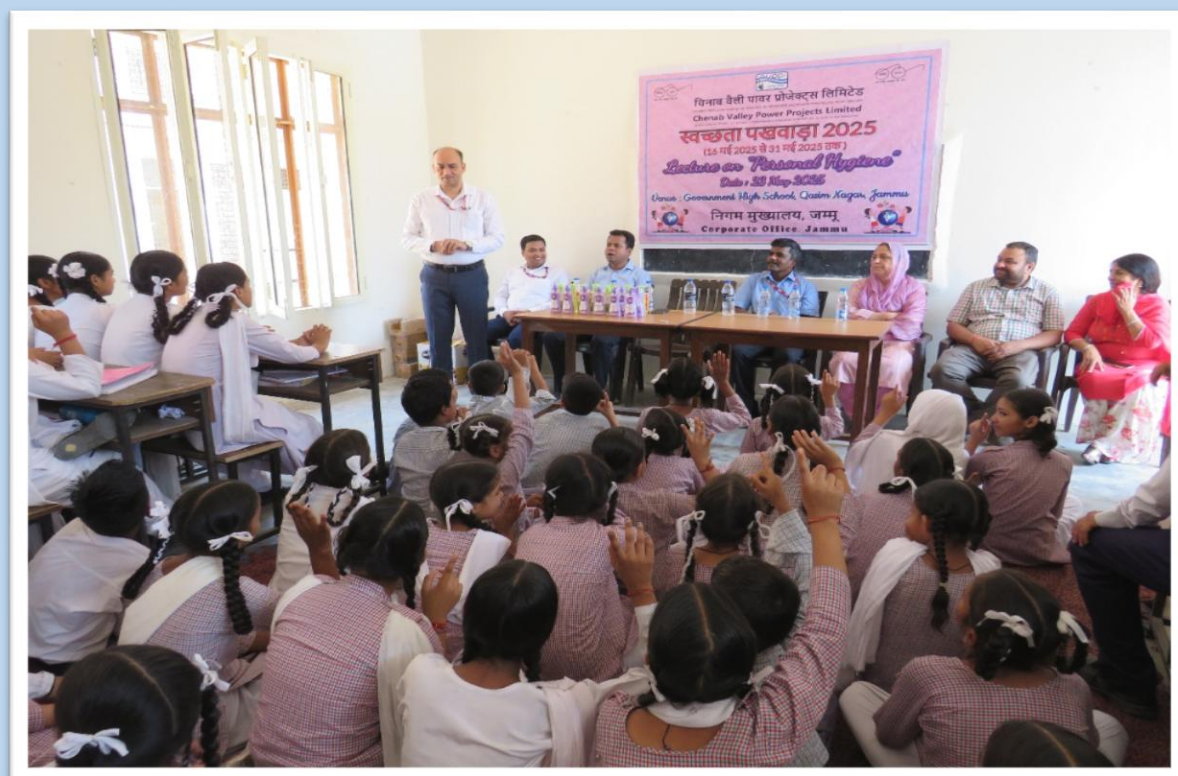
"व्यक्तिगत स्वच्छता" पर डॉक्टर का व्याख्यान Lecture of Doctor on "Personal Hygiene"