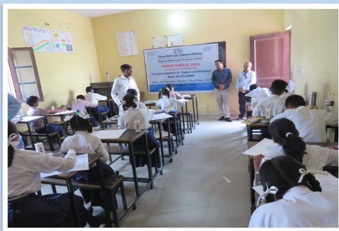
स्वच्छता व साफ-सफाई विषय पर चित्रकला प्रतियोगिता में प्रतिभागिता करते विद्यार्थी। Students participating in Drawing Competition on “Hygiene and Sanitation”